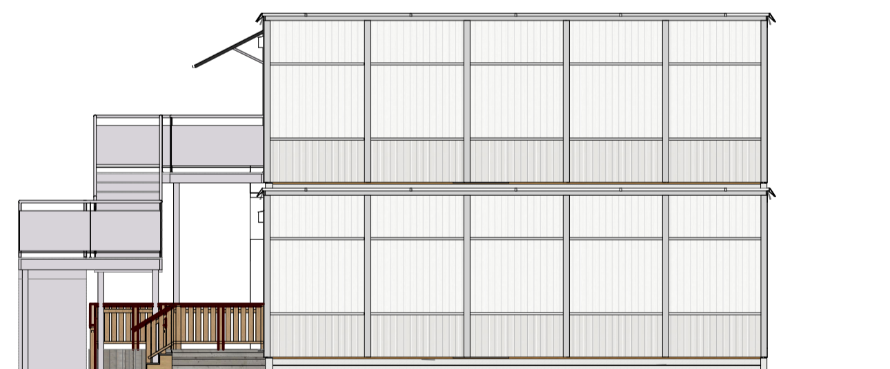
Gavelsida höger 1:100