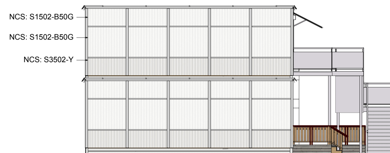
Gavelsida vänster 1:100

Ritningen är skyddad enligt upphovsrättslagen och får inte kopieras, spridas eller lösligt användas utan upphovsmännens medgivande.