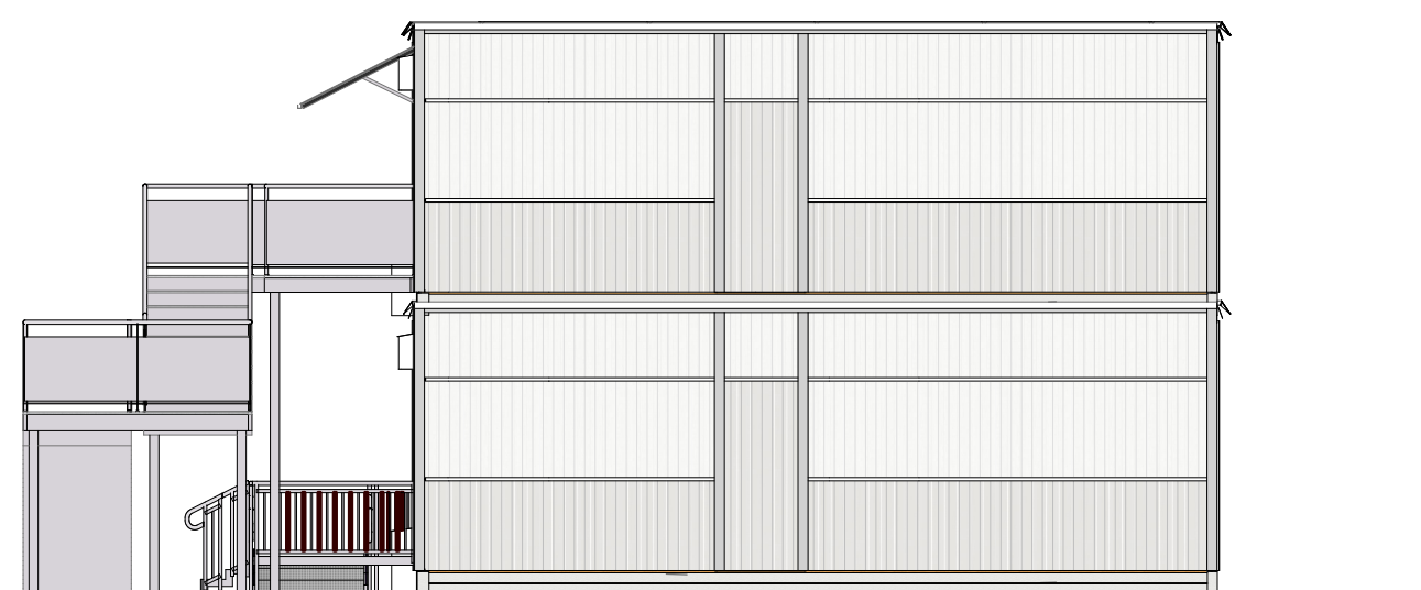
Gavelsida höger 1:100