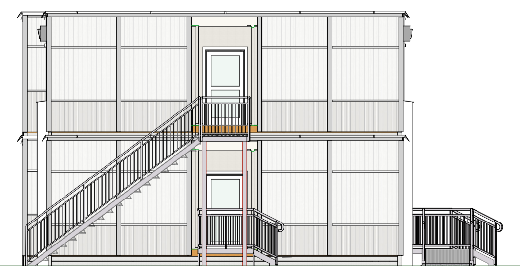
Gavlside venstre 1:100

Tegningen er beskyttet i henhold til Ophavsretsloven og må ikke kopieres, spredes eller på anden måde anvendes uden ophavsmandens tilladelse.